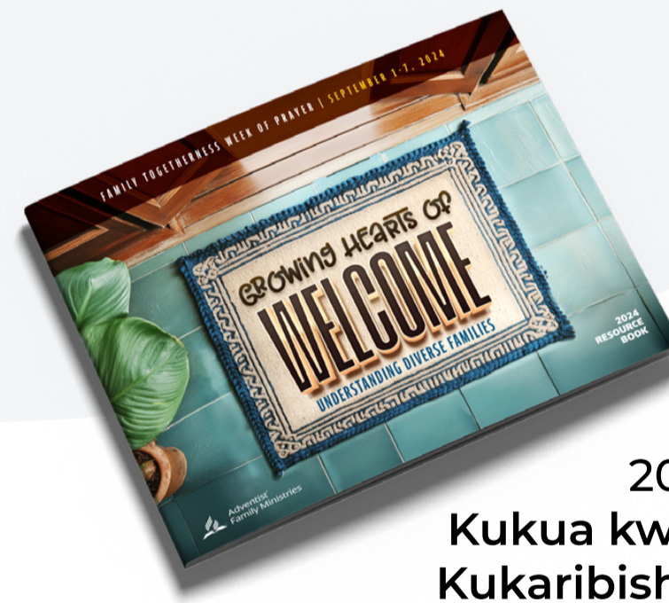
2024 Kukua kwa Moyo wa Kukaribisha: Kuelewa Familia za Aina Tofauti