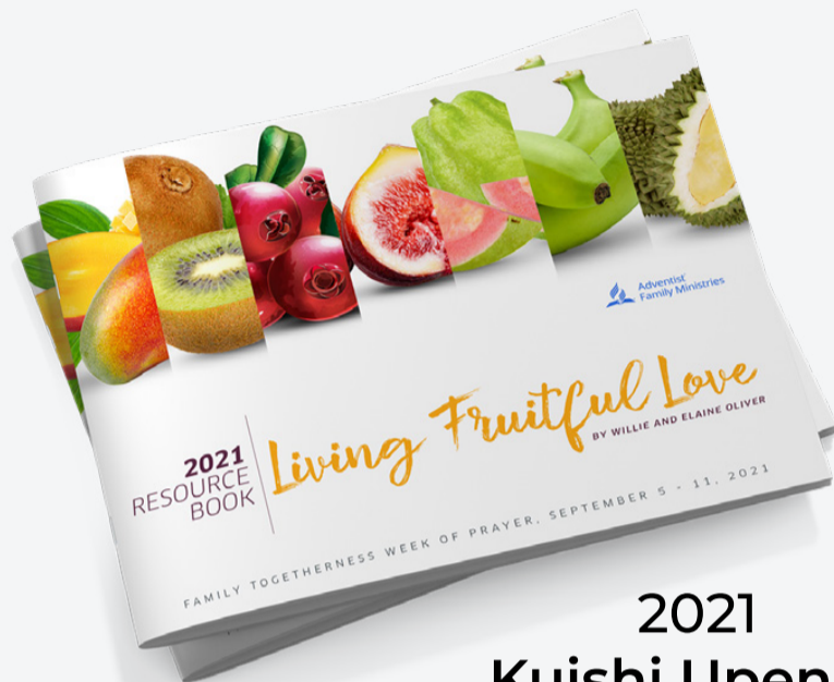
2021 Kuishi Upendo Wenye Matunda

PAKUA KATIKA: FAMILY.ADVENTIST.ORG/FAMILYWORSHIP