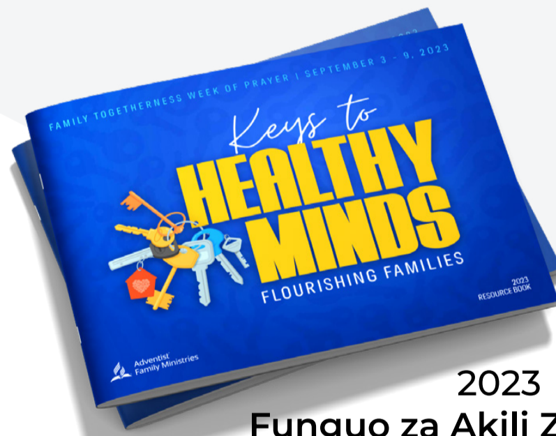
2023 Funguo za Akili Zenye Afya: Familia Zinazostawi