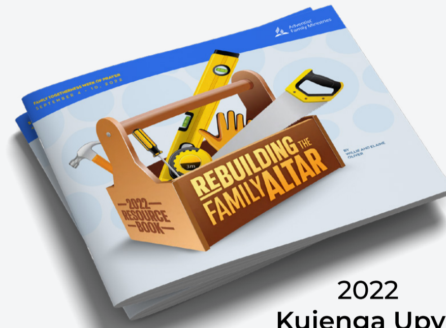
2022 Kujenga Upya Madhabahu ya Familia